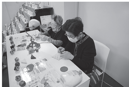
つるし飾りデモンストレーションの様子