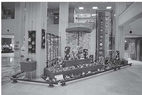
ひなまつり展2026ガイダンスホールの様子

2月14日からはけやき館ボランティアによる展示の解説やつるし飾り「ほおずき」のデモンストレーションなどを行ない、来館者の方には楽しんで展示を観ていただきました。