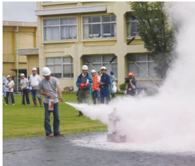
一小での総合防災訓練

質問 関東大震災から9月で100年を迎える。5月に入り、石川県能登地方で最大震度6強、千葉県南部で5強など、北日本から東日本の太平洋側や奄美から沖縄でも地震が起きている。首都直下や南海トラフでの巨大地震が危惧される中で、町は「いかなる災害等が発生しようとも、人命の保護が最大限図られること」などを目標とした計画も策定しているが、機能させるための課題もあると捉える。地域防災の現状について、町長の所見を伺う。