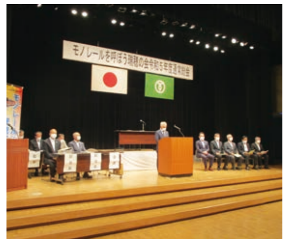
6月に開催された5年度通常総会

令和4年10月に多摩都市モノレールの延伸(上北台～箱根ヶ崎)計画および関連する都市計画道路の都市計画素案説明会が開催され、モノレール延伸が進み始めました。その中で、モノレールを呼ぼう瑞穂の会役員の皆さんの活動は、計画が動き出す上で大きな影響があったと言えます。今回、モノレールを呼ぼう瑞穂の会の皆さんからお話を伺いました。なお、今年の3月末の時点で、個人会員166名、賛助会員28(団体・個人)、応援会員210名です。