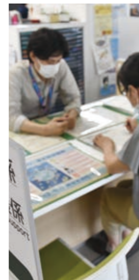
福祉課の窓口で接客している様子