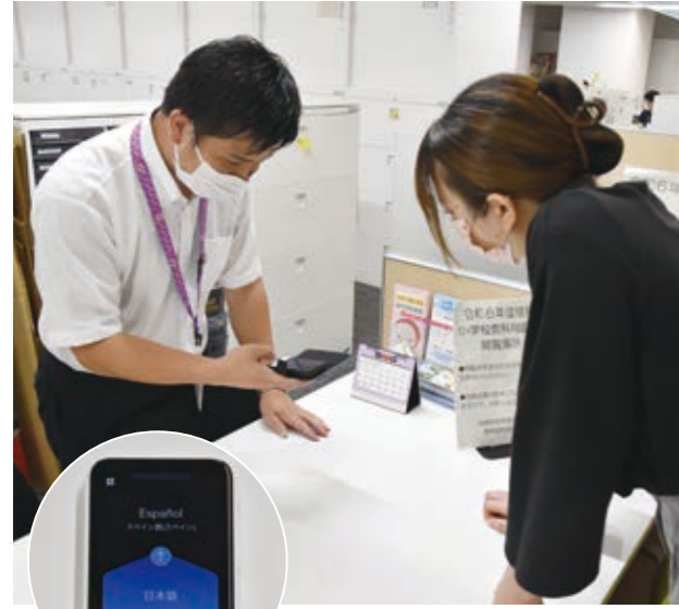
携帯型翻訳機を使用確認している職員

問② 日本語学習の機会の充実を。 教育長 適応指導教室日本語指導員による巡回指導を行っている。町内全小・中学校へ携帯型翻訳機を配備している。