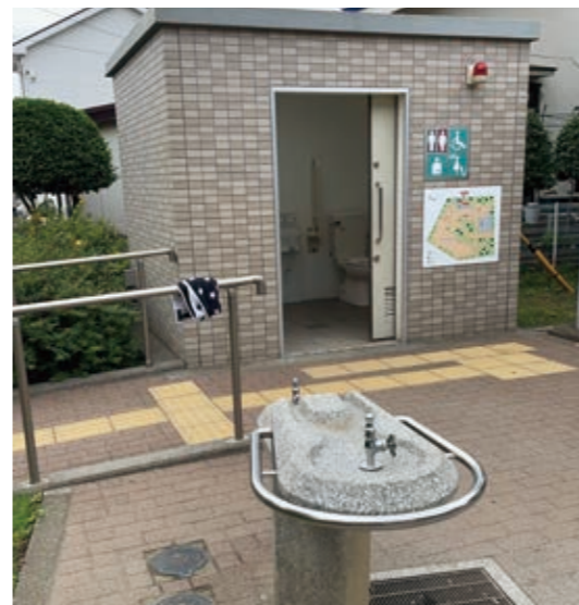
松原西公園のトイレ

質問 町には、大・小合わせて44カ所の都市公園があり、21カ所の多目的トイレが設置されている。特に、利用者の多い公園など、ほこりや床面の汚れを目にし、住民からも清掃作業の改善を求める声が多々寄せられている。そこで、次の2点について所見を伺う。 問① 清掃作業の回数など、どのような管理が行われているか。 町長 松原中央公園など規模の大きい公園では、シルバー人材センターの人員が常駐し、常に点検・清掃を行っている。それ以外の公園は、地域の町内会などに点検・清掃をお願いし、使用頻度や汚れ具合を勘案し実施される。 問② 掃除マニュアルを作成、清掃点検表などを掲示し、衛生管理状況の可視化を図るべきと考えるが、清掃を依頼する 町長 ときには、作業範囲や方法などを説明しているが、点検表の表示はお願いしていない。表示することによって、清掃担当者だけの責任が追及され、地域全体で管理しようという気持ちが薄らぐことが懸念される。