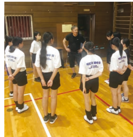
二中女子バレーボール部

ためのものである。地域連携に向けた取り組みとして、部活動指導員や外部指導員などの人材確保・予算の拡充、家庭の参加費用の負担軽減、施設・環境の整備などを推進すべきと考えるが、町の中学校の現状と課題について伺う。