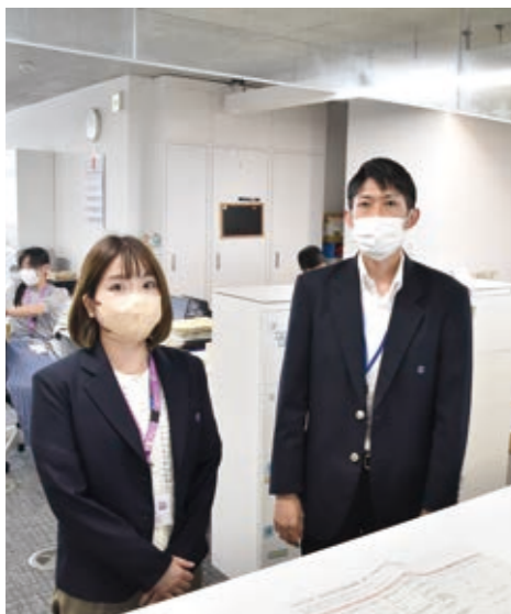
ブレザーを着用している町職員

こんな質問もありました 納税通知書の封筒を分かりやすく 町長 封筒の仕様を統一し、町民に分かりやすくなるよう取り組んでいる。