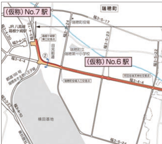
東京都、多摩都市モノレール株式会社「都市計画素案のあらまし」3ページ平面図より一部抜粋

町長 まちづくりの方向性と展望については、No.6駅周辺の武蔵地区に、農業、商業、工業のデジタル化を軸とし