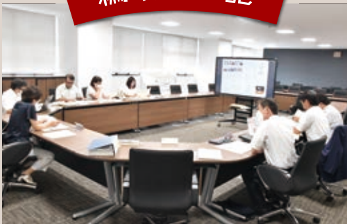
議会だより編集の様子

新しいメンバーでの編集作業がスタートしました。全員が議会だよりの編集を希望して集まったメンバーで、活発な意見が飛び交います。「議会だよりは、こんな風に議員が時間をかけて作っていたことに驚きました。」新人議員の言葉ですが、20年前、私もびっくりしたことを思い出します。