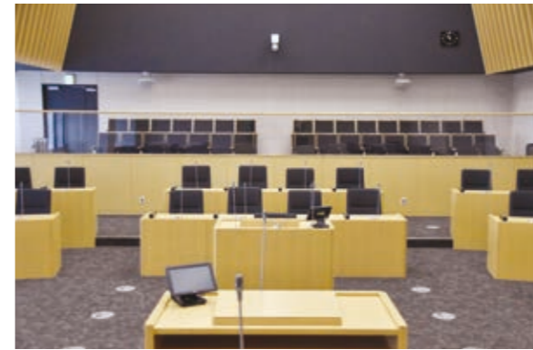
議長席から見た議場（後方は傍聴席）

一般質問は深い議論を行うため、原則としてあらかじめ通告しておくことになっています。