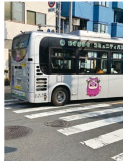
町内を運行するコミュニティバス

町長 地域公共交通会議において、地元の声をもとにしながら、ルート、料金、停留所の設定などを行い、逐次、効果検証を図りながら、より利便性の高