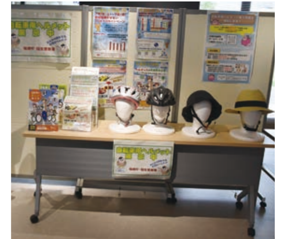
庁舎内に展示されているヘルメット