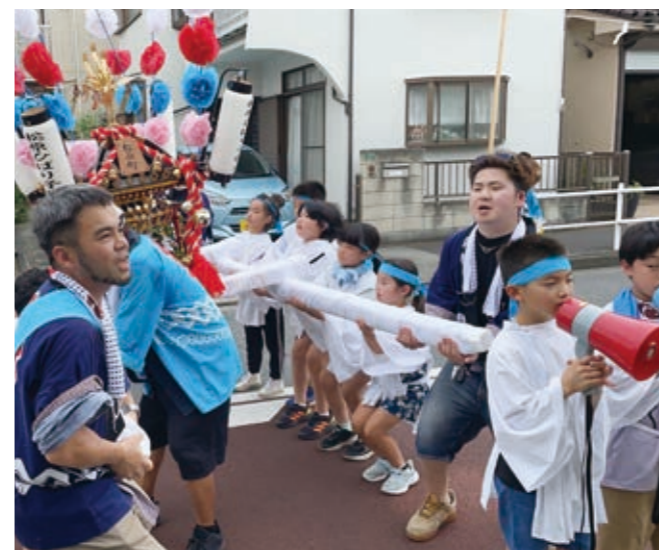
子どもみこし (松原ひばり子供会)

質問 今後加速する超少子高齢化の中で、地域力の向上は行政では担いきれない住民福祉を補完し、安全・安心な日々の暮らしを担保する上で必須である。しかし、現在、町内会や子ども会などの加入