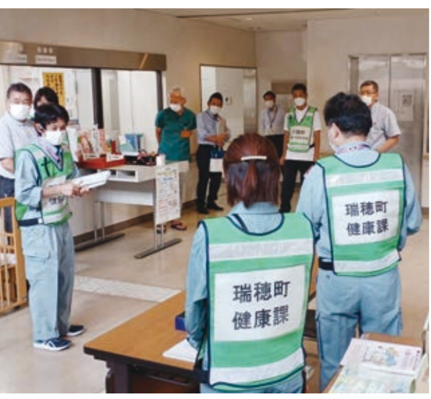
保健センターで行われた災害時医療救護所設置訓練

町長 災害拠点病院が重傷者などの治療に集中するため、トリアージを行い、軽傷者などは医療救護所で手当て